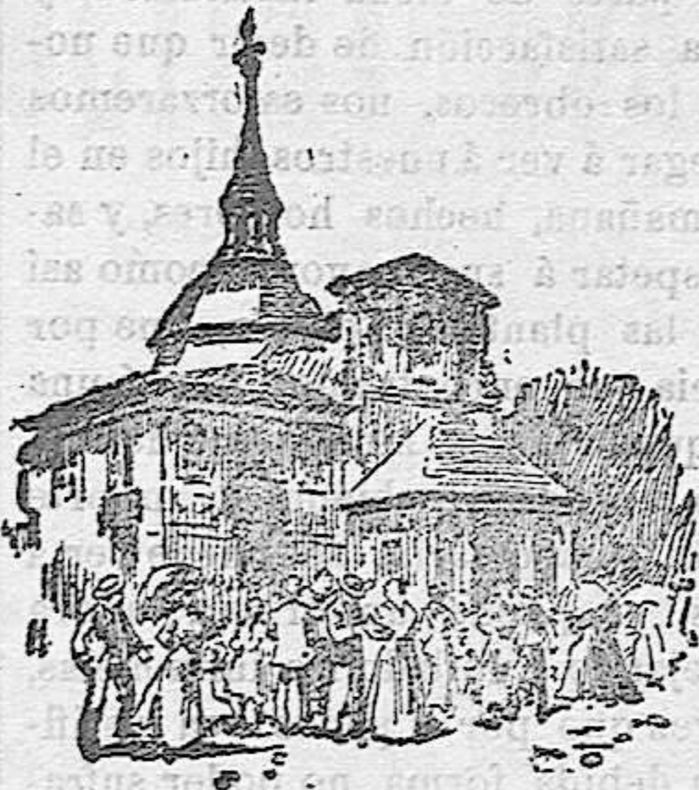
LA ERMITA DEL SANTO

La pradera y el cerro, en que brota la fuente, habían tocado en suerte en el reparto de la tierra de la conquista, al capitán Iván ó Juan de Vargas. Este soldado había levantado su casa solar en la que hoy es plazuela de la Paja y entonces era una cumbre al Sur de Madrid. Casa rústica, casa de labor y casa fuerte á un tiempo, desde donde se veía el valle del Manzanares con sus cerros y dehesas, y más allá la vega surcada por el entonces limpio río y cubierta de sombrías verduras. Los descendientes de Iván conservaban aquella tierra y del fondo de la servidumbre de esta ilustre familia, sale un matrimonio Santo: Isidro y María.