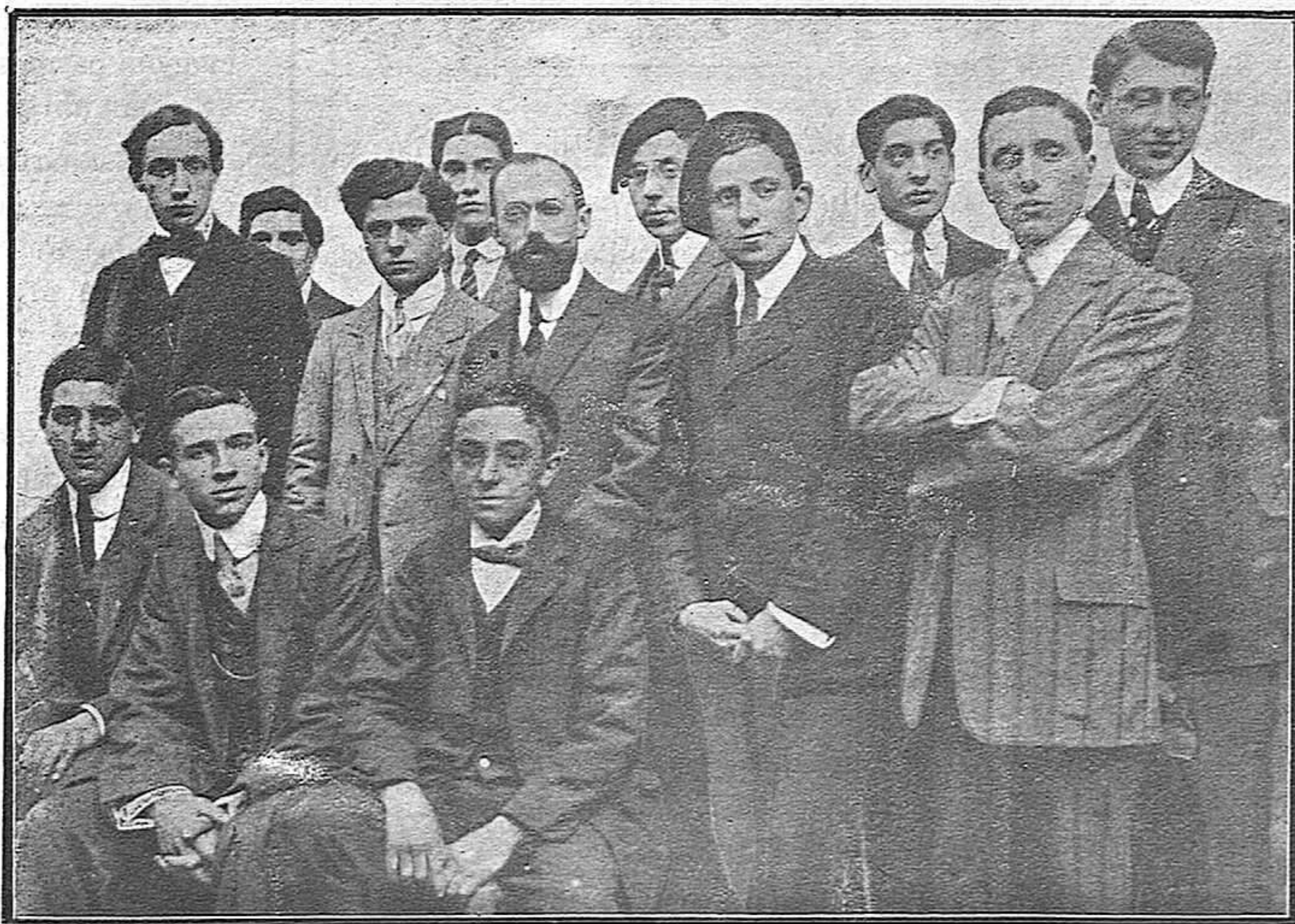
Grupo de jóvenes del Requeté Jaimista de Gerona

En estas condiciones llega el día del aplech : se celebra éste por parte de los tradicionalistas en completo orden durante toda la mañana; á las tres ó tres y media de la tarde llega el primer tren espe-