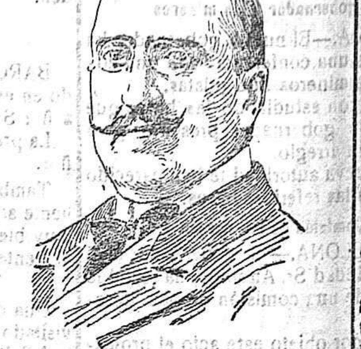
SEÑOR PRADO Y PALACIO, NUEVO SUBSECRETARIO DE GOBERNACION.

Es verdad que el asiento costaba 50 francos, y la sala estaba de bote en bote.