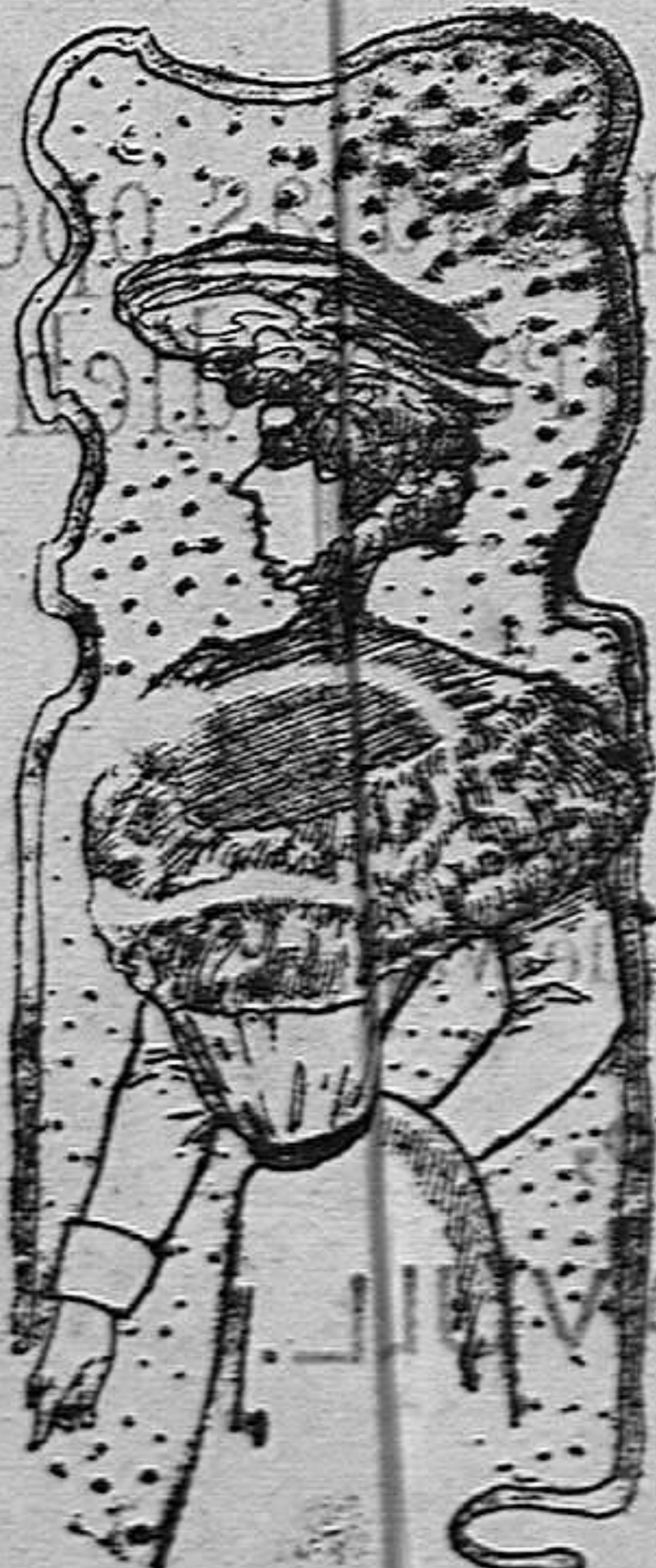
Esclavina para invierno La prenda que damos á conocer

en ese dibujo se confecciona con terciopelo negro, y, por su sencillez y abrigo, es generalizada en esta época del año.