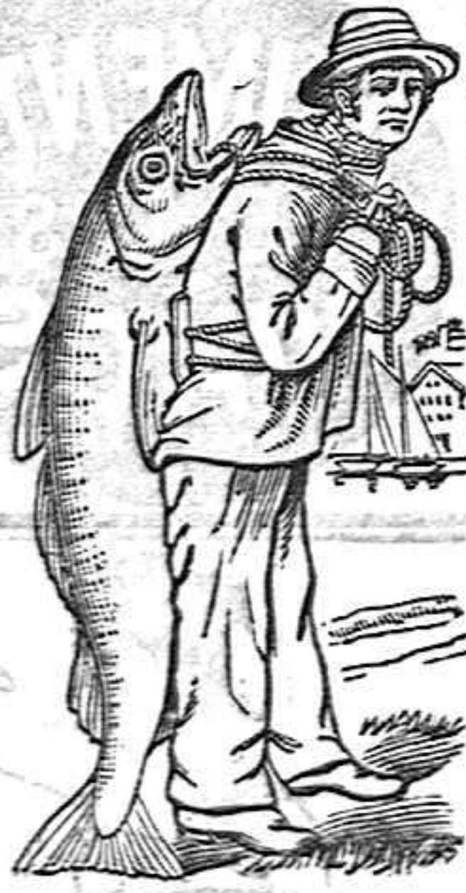
MARCA DE FABRICA