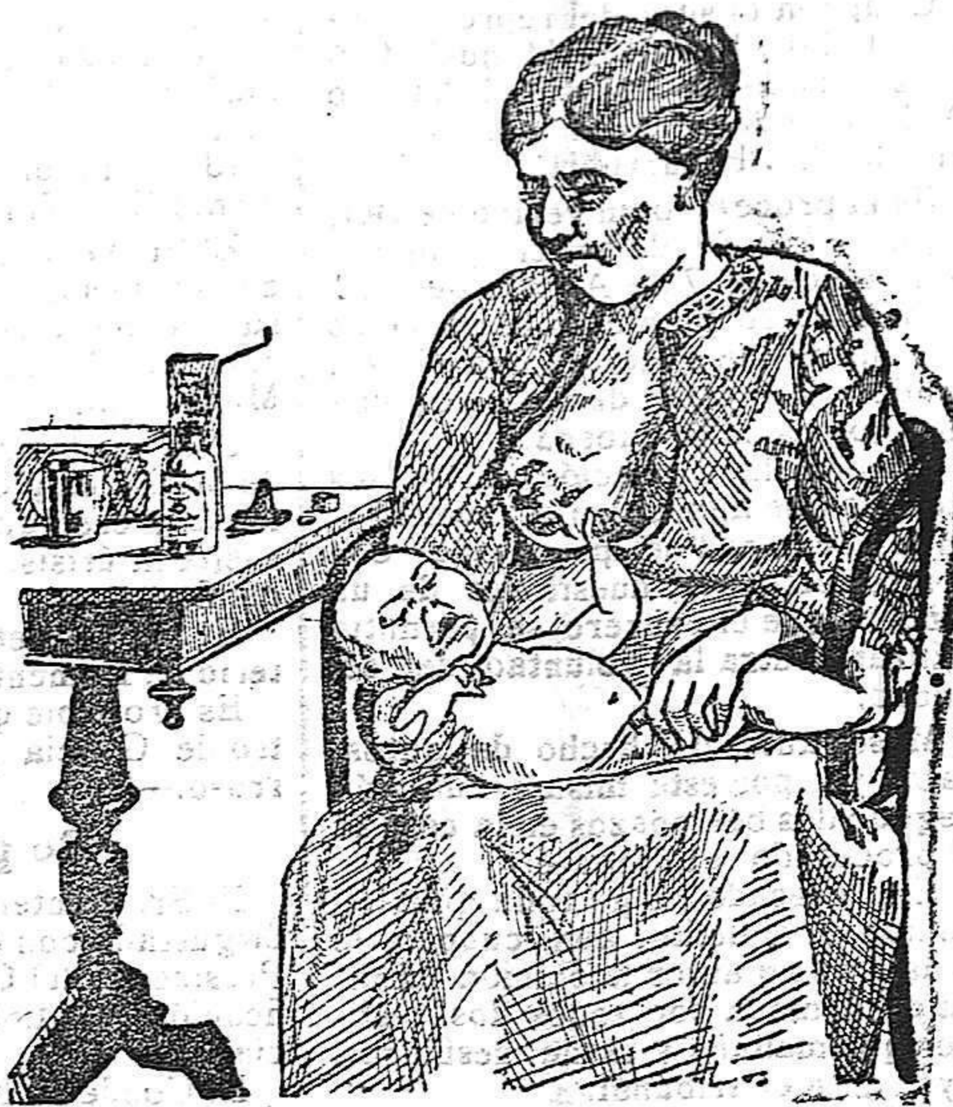
La que no hizo caso del Salverol