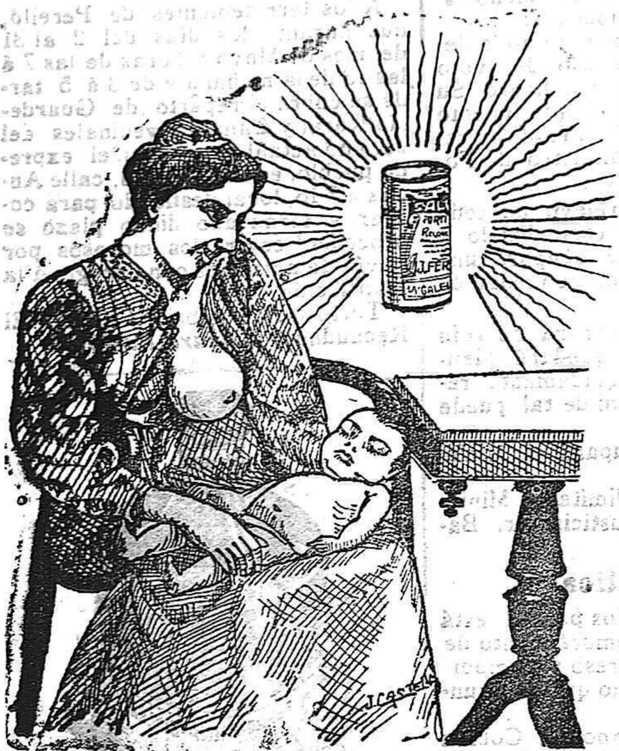
La que hizo caso del Salverol

EN FARMACIAS ESPAÑOLAS Y EXTRANJERAS Depósito general S. A. del Salverol en Santa Bárbara (Tarragona)