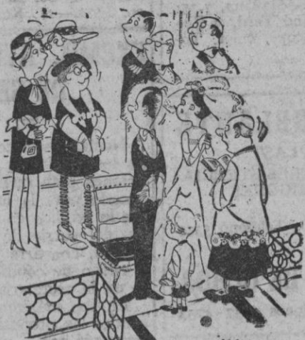
—No es usted quien debe contestar "sí", es la novia...

EN TELEVISION puede estar seguro si es Westinghouse CASA SOLERA