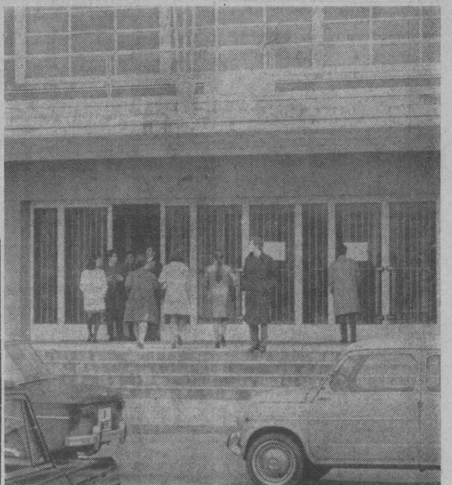
Madrid.—Varios alumnos se dirigen a sus clases en la Facultad de Derecho de la Universidad de Madrid, en la que, como en otras, se han reanudado las enseñanzas, tras el paréntesis de las vacaciones navideñas.

A falta de un donante, el equipo que intervendrá en esta operación se halla a punto en la planta de cirugía torácica de la residencia de La Paz.—Cifra.