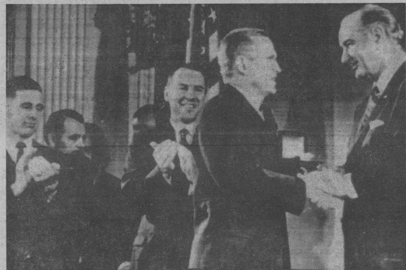
Washington.—Los astronautas del "Apolo 8", que estuvieron en órbita lunar durante su vuelo, han sido recibidos por el presidente Johnson en la Casa Blanca, y también estuvieron en el Congreso. Aquí vemos a Borman, Lowell y Anders, junto al presidente.

Los aviones de línea han podido utilizar ambos aeropuertos el pasado lunes después de que algunas avionetas rozasen la espesa niebla existente con partículas químicas que transforman la niebla en lluvia. En poco espacio de tiempo la visibilidad aumentó de trescientos a novecientos metros.—Efe-Reuters.