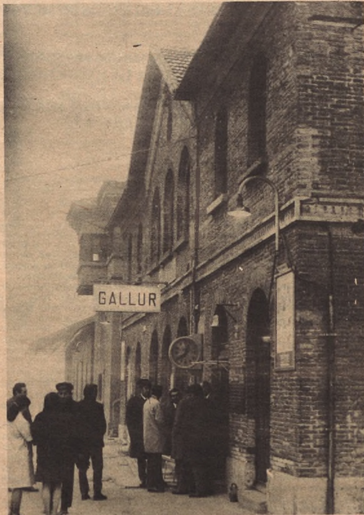
La estación de Gallur que pronto se verá reemplazada por otra moderna de líneas funcionales y con comodidades para los usuarios.

Gallur, poco a poco, va completando sus estructuras para poder albergar en un próximo futuro un pequeño núcleo industrial dotado de toda clase de servicios y magníficamente comunicado. No sabemos si nuestra villa estará incluida o no en la Acción Especial de las comarcas Borja-Tarazona, pero en cualquier caso la creciente industrialización de Navarra, la ya iniciada de Cinco Villas y la potencia de nuestra agricultura permite mirar con optimismo el porvenir. Siempre, claro está, que por ese futuro se trabaje desde hoy con entusiasmo y espíritu de sacrificio porque regalarnos, no nos regalarán nada. El maná dejó de caer hace muchos siglos.