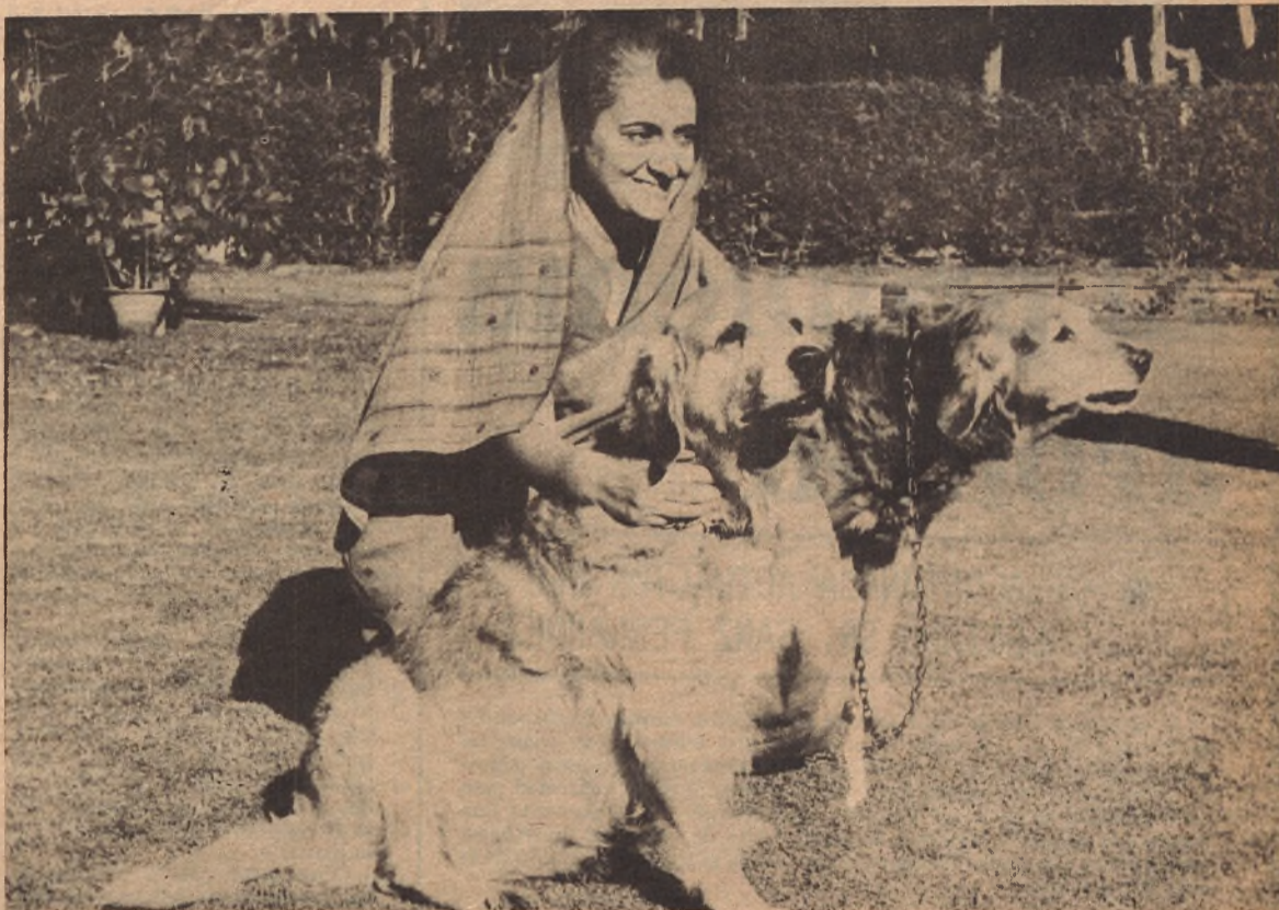
Indira Gandhi, que es además Ministro de Información, se encarga del cine Hindú, está impulsando a los realizadores de la "nueva ola".