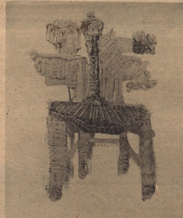
Una silla rota que tiene como respaldo a un toro haciendo el pino la cabeza de un moro con su turbante; una esfinge.

-Para mí esto es muy complejo. No creo en el arte como tal: creo en el hombre. El hecho de pintar es una