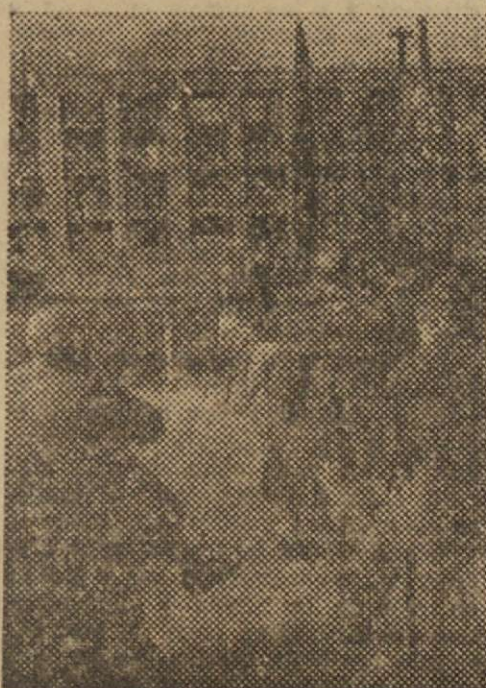
Clausura del cursillo de delegados menores de empresa el día 18 de Julio de 1952

El sábado pasado, día 19, salieron para Valencia dos escuadras de camaradas de la Centuria Luis