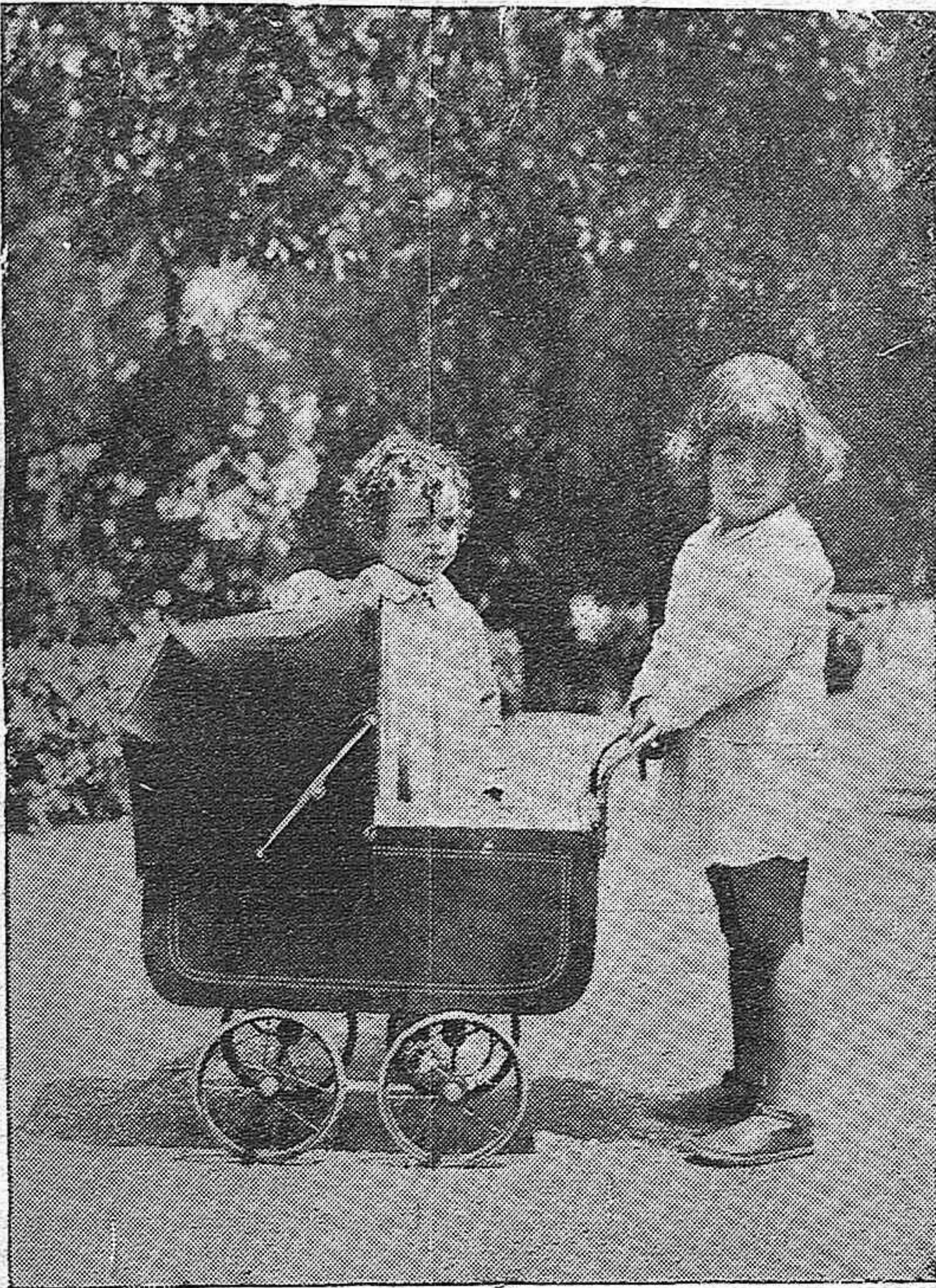
EN LOS JARDINES DEL DUQUE DE RIVAS.—Los encantadores y asiduos concurrentes, que acuden en las mañanas de mayo para solazarse con sus juegos infantiles