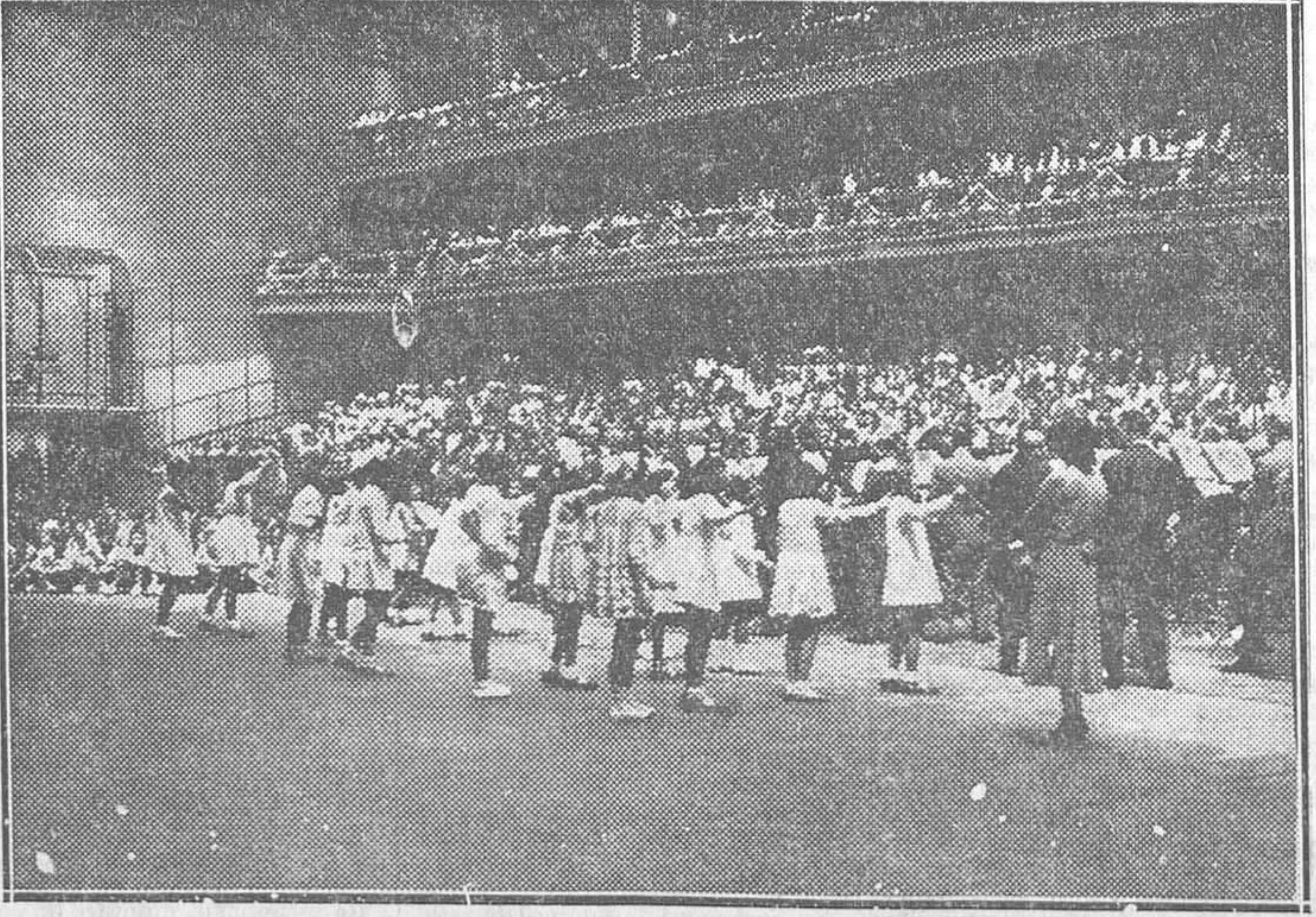
EN LA LATA.—Festival celebrado ayer en honor de los niños de los colegios del distrito de La Latina que han terminado su edad escolar en este fin de curso