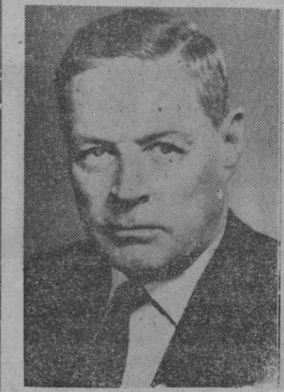
Charles Bohlen, técnico norteamericano en asuntos soviéticos, que ha sido nombrado embajador de su país en París

Sólo se ha planteado el problema (Continúa en la página 6)