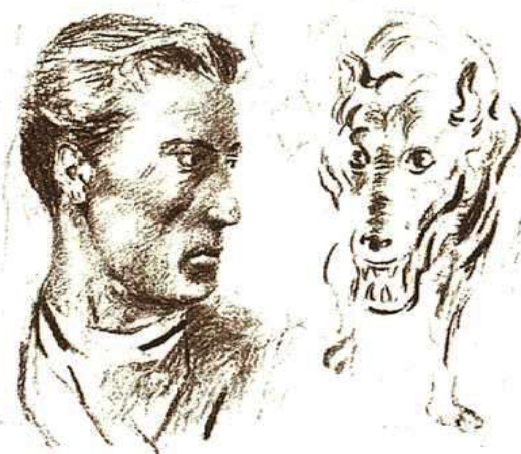
JULIO GUTIÉRREZ MAS, LA NARRACIÓN DE A. GORDON PYM, ANAYA, 1992.

ballenero. En el relato se combinan los contenidos propios de las novelas de mar con el propio de los libros de viajes y exploraciones. Seguramente que Poe buscaba aunar estos dos motivos, dado el interés del público del momento hacia estas cuestiones.