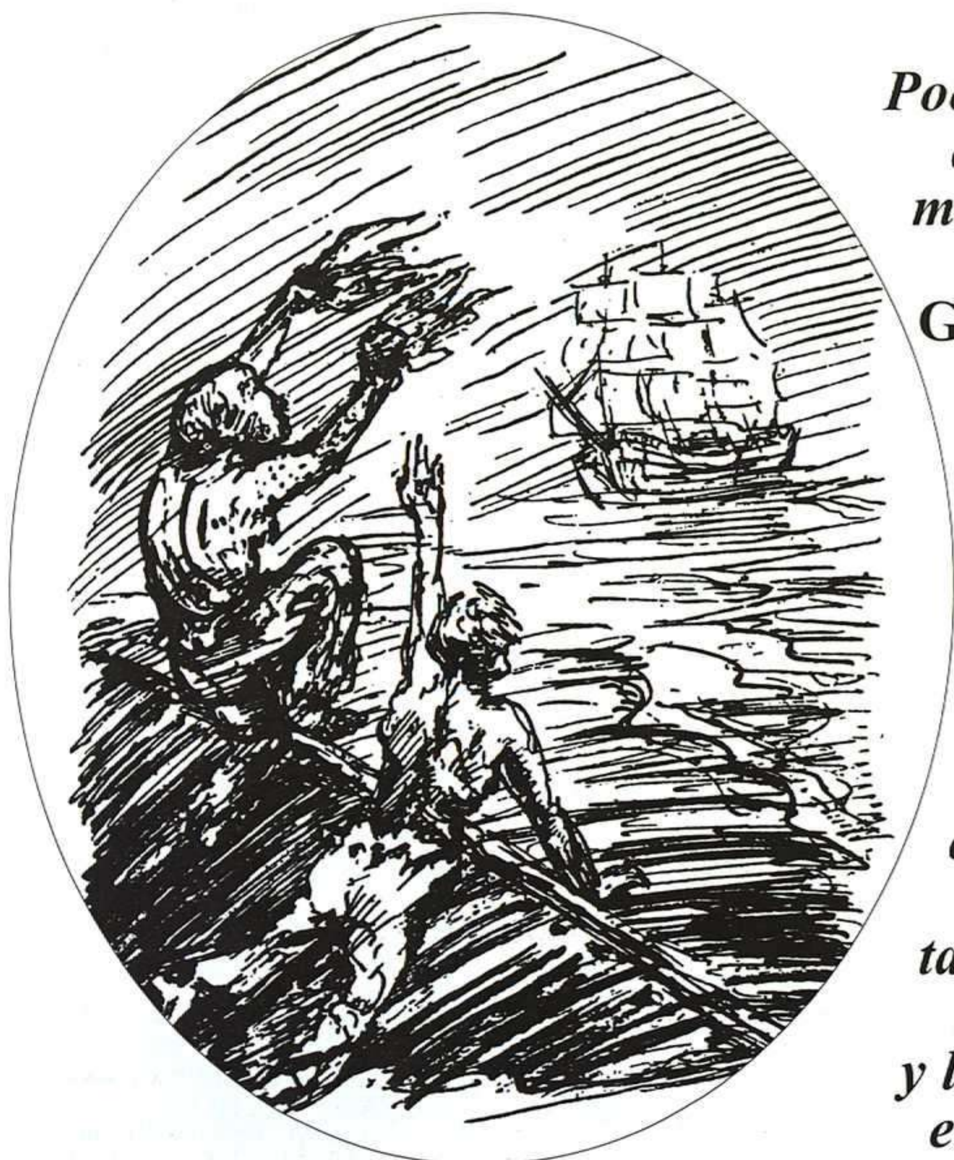
ALFRED KUBIN, THE NARRATIVE OF ARTHUR GORDON PYM, CHANCELLOR PRESS, 1996.

Poe hizo una sola incursión en el ámbito de la novela, con un resultado cuando menos controvertido. Este único intento se tituló La narración de Arthur Gordon Pym, y apareció primero como folletín en la revista Southern Literary Messenger a lo largo de 1837. Un año después, vería la luz en forma de libro que no alcanzó ningún éxito de crítica o de ventas a pesar de que el autor había escogido el tema de las aventuras marítimas porque estaban de moda en la época. Por si esto fuera poco, el autor tuvo que soportar también la acusación de plagio. Pero el tiempo ha puesto las cosas en su sitio, y la novela ha sido analizada y valorada en su justa medida dentro del conjunto de la magnífica obra de Poe.