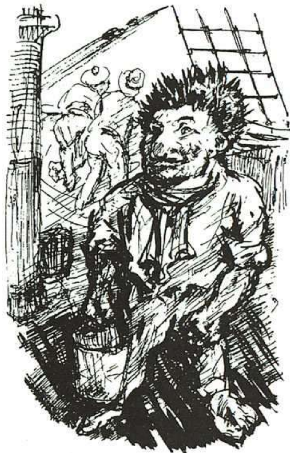
ALFRED KUBIN, THE NARRATIVE OF A. GORDON PYM, CHANCELLOR PRESS, 1996.

La trama de la novela consiste en el rosario de peripecias y sucesos en que el protagonista se verá involucrado desde que su afán de navegar lo conduce a embarcarse clandestinamente en un buque