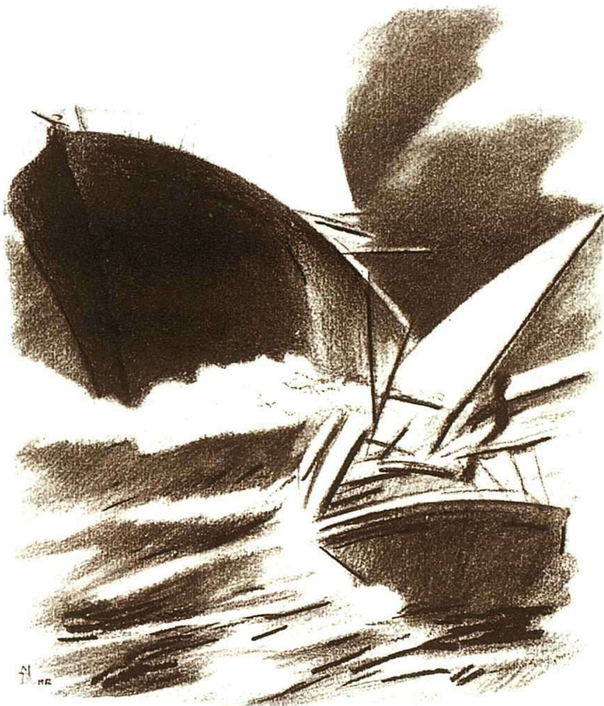
JULIO GUTIÉRREZ MAS, LA NARRACIÓN DE A. GORDON PYM, ANAYA, 1992.

No puede, sin embargo, decirse que existan tres novelas distintas o ajenas estructuralmente entre sí. La primera historia prepara y anuncia situaciones y personajes, teniendo literariamente un referente claro en El Quijote , donde la primera salida del hidalgo sirve de pórtico a todo el texto cervantino. La histo-