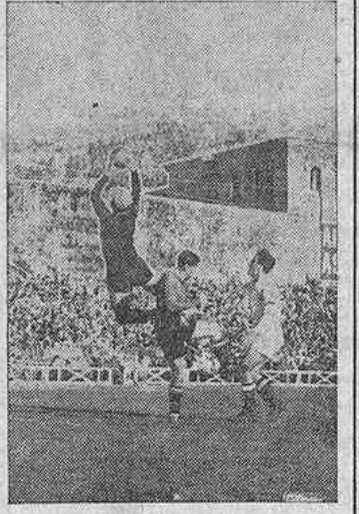
A un tanto empataron ayer tarde el Real Madrid y el Valencia en el campo del primero. He aquí bloqueando magníficamente un balón a Elizaguirre, protegido por una defensa, que impide el acoso del delantero centro del Madrid, Pruden.