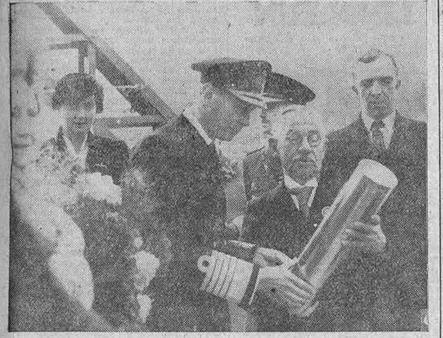
Los Monarcas británicos visitan la presa en construcción del Derbyshire, que ha de abastecer de agua a las poblaciones de Derby, Leicester, Nottingham y Sheffield, y se informan personalmente del estado de las obras.