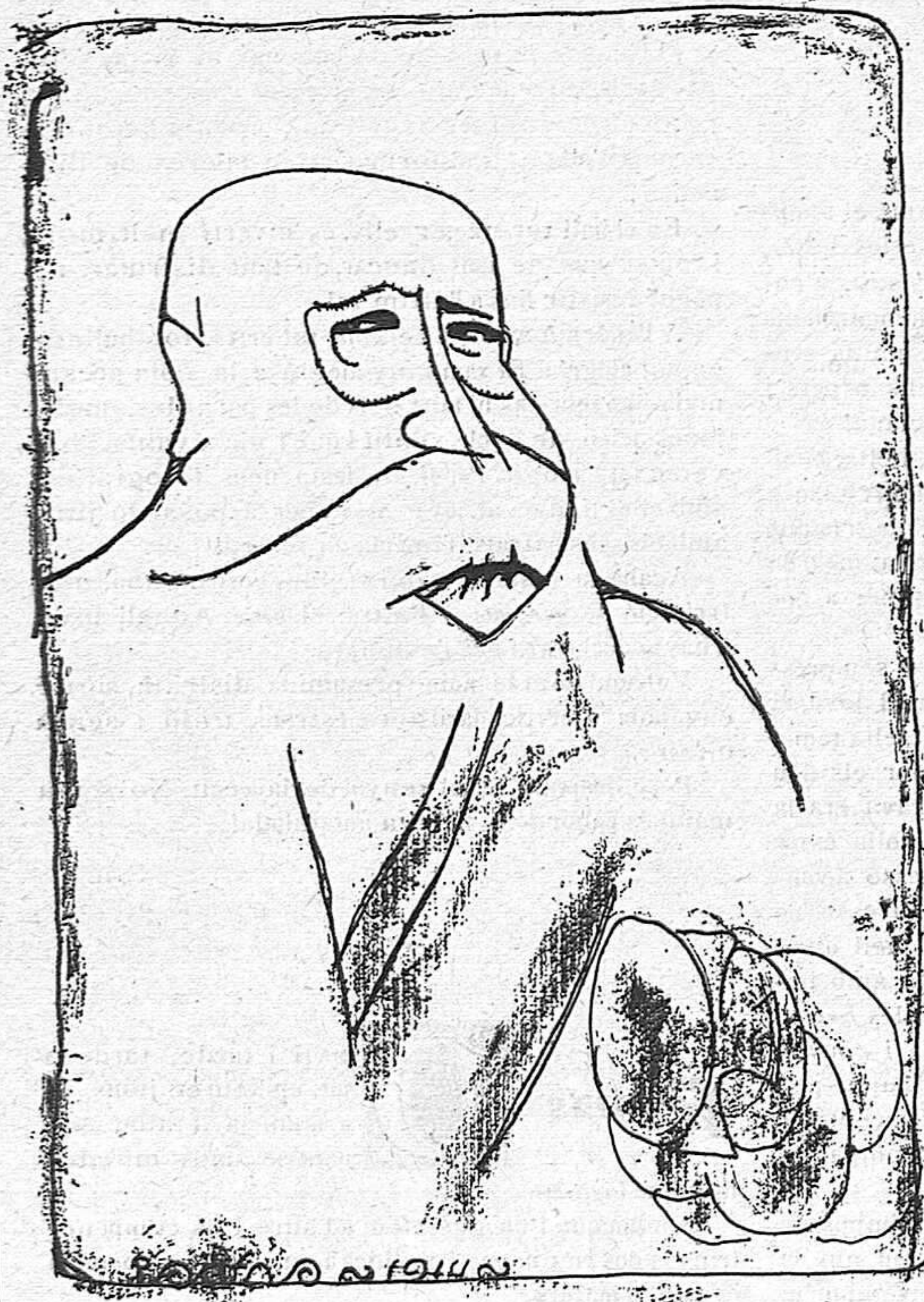
EL NOSTRE GOVERNADOR

Una bella palafollenca, ha hipotecat formalment el cor d'un ex-secretari d'uns Jocs Florals qui dóna conferències