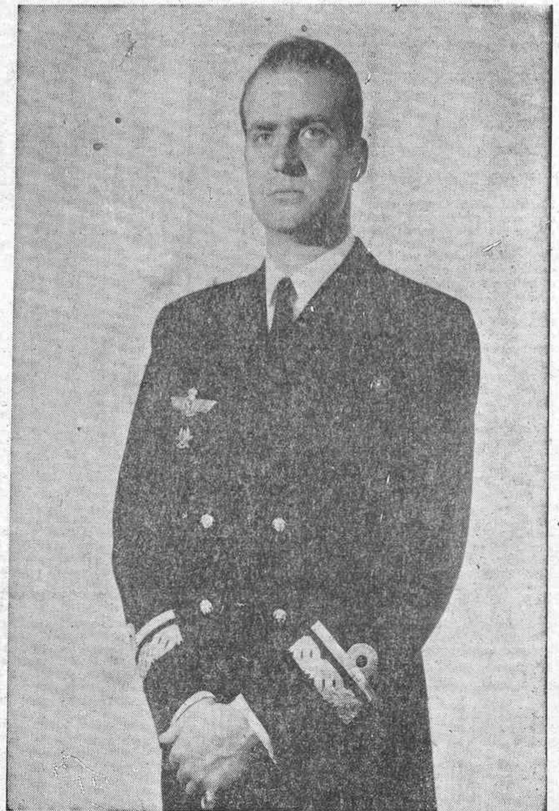
MADRID, 30 (Pyresa). — El presidente del Gobierno ha cursado al presidente de las Cortes la siguiente comunicación:

✽ 7'30 horas Las Casas Civil y Militar del Jefe del Estado comunican que, según informan los médicos de turno, el Caudillo ha descansado tranquilamente durante toda la noche. ✽ 12'15 horas El Caudillo, según un nuevo comunicado, ha pasado la mañana descansando. ✽ 13'30 horas Parte médico: «El estado general no ha sufrido modificaciones ostensibles. Los signos de insuficiencia cardíaca congestiva son moderados y han desaparecido las extrasístoles ventriculares. La tensión arterial y frecuencia» (Pasa a la siguiente)