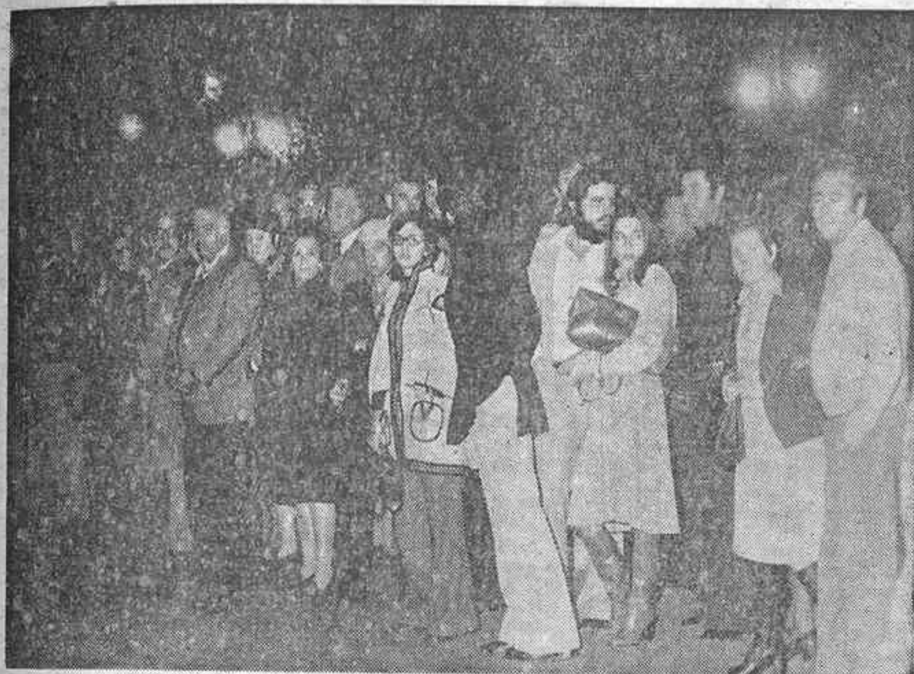
La aglomeración de público en las inmediaciones del Palacio de El Pardo es constante, manteniéndose de día y de noche, con la ansiedad reflejada en los rostros.