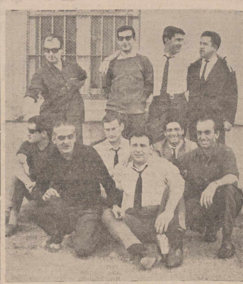
La foto recoge un momento en que la Peña de Amigos posa para el fotógrafo