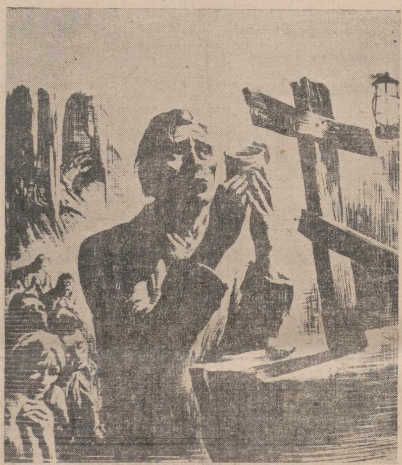
Una escena tomada en el tristemente célebre campamento de Vorkuta, donde la N.T.S. organizó una histórica revuelta de trabajadores esclavos

Un día de verano, cierto turista belga que visitaba la región de Odesa fue súbitamente abordado por la Policía. La atención de los guardias no se dirigió hacia el contenido de los bolsillos del turista ni hacia su documentación, sino que se concentró en una bolsa en la que aquel llevaba unas naranjas. Llevado a la Comisaría, el turista observó con asombro como las naranjas eran contempladas por todas partes, sopesadas cuidadosamente y, por fin, atravesadas con largas agujas. Cuando vieron que salía zumo, los policías le devolvieron las frutas, bastante espachurradas por cierto, con mil excusas.