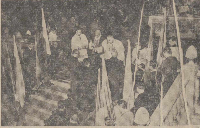
Madrid.—Un aspecto del altar mayor del templo de San Francisco del Grande, durante la Comunión de los fieles en la celebración de la plegaria colectiva por Hungría, en cuya misa ofició el Obispo de Ereso y coadjutor general de la Acción Católica Española, don Zacarías, de Vizcarra.