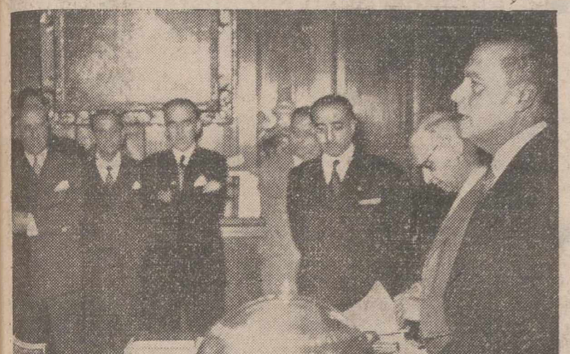
El ministro de la Gobernación, señor Pérez González, en el acto de dar posesión de su cargo al nuevo subsecretario del Departamento, señor Rodríguez de Miguel.

Toma posesión el nuevo subsecretario de Gobernación