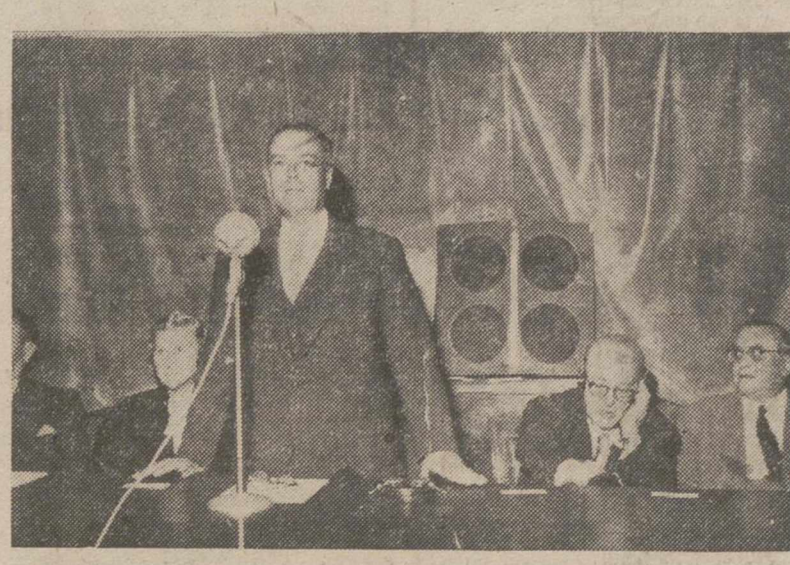
Madrid.—El Ministro de la Gobernación, don Blas Pérez González, durante su discurso en el acto inaugural de dicho Congreso, que se celebra en la Facultad de Medicina, y durante el cual fueron entregados los Premios Píizer a seis médicos españoles.