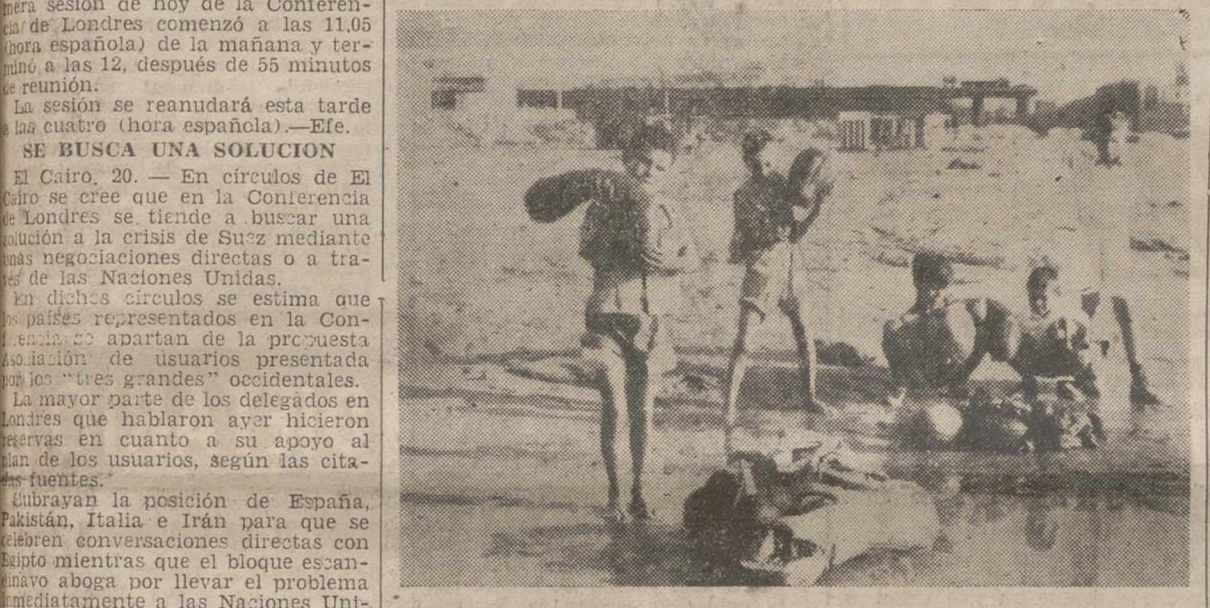
Melilla.—Después de la fuerte tormenta caída sobre esta ciudad, en la que el nivel del agua, que inundó las calles, llegó a alcanzar una altura de 30 centímetros, estos niños juegan en las cercanías del Río de Oro con algunas calabazas, melones y pimientos, que arrastró el agua.