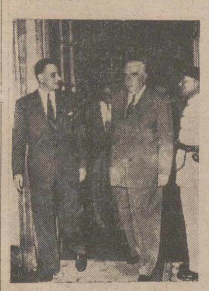
El presidente del Supremo de Río de Janeiro, asesinado

Port Said, 12.—Todos los pilotos porteamericanos empleados en el Canal de Suez se espera que abandonen el trabajo a fines de esta semana, de acuerdo con la comunicación que les ha hecho la dirección de la antigua Compañía de que pueden irse si lo desean. De acuerdo con los datos facilitados, actualmente trabajan en el Canal de Suez, 100 pilotos, excedidos los que trabajan en Port Said y en la terminal de Port Suez. De estos pilotos, solamente 26 son egipcios, y pilotos de primera clase, únicamente nueve. Estos pilotos de primera clase son los que conducen los buques de mayor tonelaje a través del Canal. Los mejores pilotos del Canal son extranjeros y esto hace pensar que si todos ellos dejan ahora sus puestos, el Canal quedará prácticamente cerrado para los superataques y los grandes barcos de carga o pasaje. La estadística de los pilotos extranjeros es la siguiente: 32 ingleses; 23 franceses; 4 nortuegos; 7 griegos; 3 daneses; 7 alemanes; 26