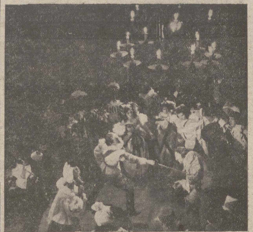
Una espectacular escena de la obra dramática «Cyrano de Bergerac», donde se aprecia la fastuosidad y propiedad del montaje, que será representada por la Compañía de alta comedia «Lope de Vega», bajo la dirección de Tamayo, durante las próximas ferias de San Antolín

La Compañía "Lope de Vega" y los Ballets internacionales de Roberto Iglesias y Rosario, actuarán durante los días 5, 6, 7 y 8 de Septiembre