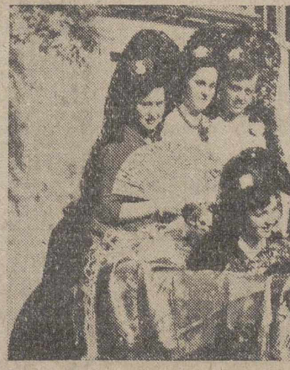
Este ramillete de bellas señoritas, ataviadas con las españolismas y casidas prendas del mantón de Manila y la mantilla de blondas, presidió la novillada que a beneficio de las J. O. A. C. se celebró el domingo en nuestra plaza. Con su belleza fueron un aliciente más de este festejo, en el que todo resultó grato, excepto la floja entrada que registró el ovillo coso.