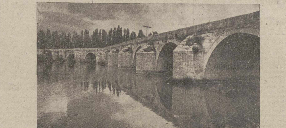
El puente romano de Torquemada, reformado por la magnificencia del inquisidor Fray Tomás Torquemada

Testigo y baluarte de la lucha contra la afrancesada, divisor en tiempos lejanos de Castilla y León, por él han desfilado, personajes romanos cuando esta Villa se llamaba «Porta Augusti». Por él pasarían Reyes y guerreros, caravanas de paz y de guerra y sus piedras, tostadas a través de los siglos por rayos del mismo sol y cuyos tajamares han corrido el agua resistiendo avenidas impetuosas o peinando la mansa corriente de su estajo. Le vimos en los tiempos del Glorioso Alzamiento Nacional, enorgullécense al prestar sus crevantes servicios, cuando por el general Mola era cruzado, en paso para celebrar en esta Villa histórica entrevistas con el también general Saliquet o para dirigirse a aquel presidir batallas o visitar frentes de combates. Cruzaron su calzada los héroes de El Alcázar de Toledo, y pocos días después, nuestro invitado Gaudilio acompañado de lucido cortejo en el que figuraban brillantes uniformes cubiertos con polvo de las primeras batallas, acompañado también de altas personalidades civiles y eclesiásticas y una nutrida representación de moros ilustres, y siempre amigos de la verdadera España, en aquel primero de octubre del año 1936, a su entrada en nuestro puente, recibía los aplausos de este vecindario como anticipo del nombramiento oficial que pocas horas después, iba a recibir en Burgos como Generalísimo de nuestros Ejércitos y Jefe del nuevo Estado español.