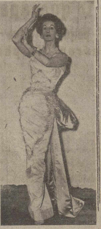
Bárbara Goalen luciendo una creación denominada «Al caer la noche» modelo de una colección inspirada en la moda de mil novecientos treinta y tantos, unida a las tendencias actuales. El material empleado es el raso blanco duquesa, bordado en rosa.