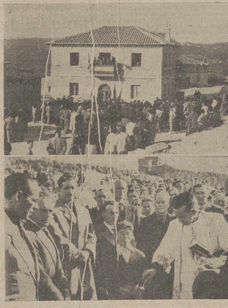
Los vecinos de Berzosilla escuchan las palabras del Gobernador Civil pronunciadas desde el balcón del nuevo Ayuntamiento. Abajo: Un momento de la bendición del edificio oficiada por el Sr. Cura Párroco en presencia del Gobernador Civil y Jefe Provincial del Movimiento y autoridades locales.