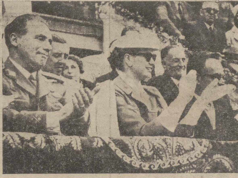
Palma de Mallorca. — Con ocasión de su estancia en esta ciudad, se organizó una corrida de toros en honor de los Principes de Monaco. Veámoslos aquí, rodeados de admiradores y curiosos, momentos antes de dar comienzo el festejo.