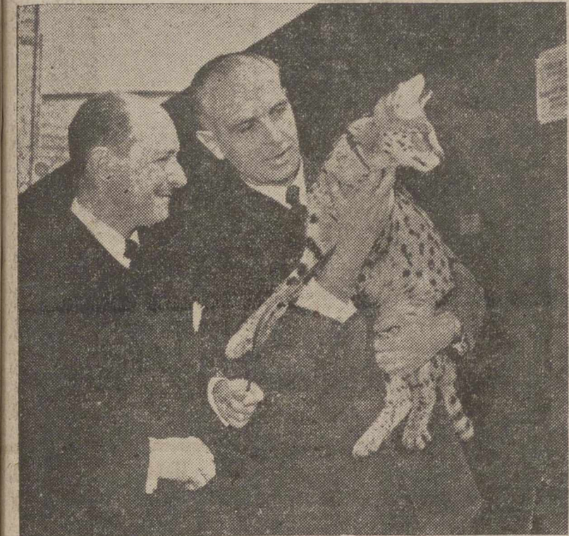
En su actual viaje por Alemania, el Alcalde de Madrid ha visitado el famoso parque zoológico de Francfort. El director del parque le muestra uno de los más jóvenes ejemplares del recinto.