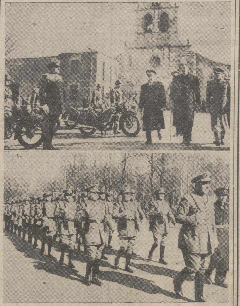
Con motivo de la festividad del Santo Angel de la Guarda, las autoridades civiles palentinas, revisitan a las fuerzas de la Policía Armada a quienes se ve en el grabado inferior desfilar marcialmente ante dichas autoridades.

El Cuerpo de Policía celebró ayer en nuestra capital diversos actos con motivo de la brillante conmemoración de su Patrono, el Santo Angel de la Guarda.