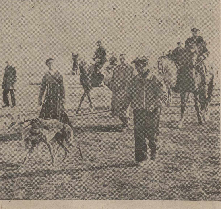
«Imperio», de Madrid, y «Chica», de Palencia, que han sido las galgas más destacadas del Campeonato de España.

MADRID. — Sin pasión de palentinos, podemos afirmar con toda certeza que la mayor expectación del XVIII Campeonato de España de galgos en campo, celebrado en la Venta de la Rubia, la ha causado la colera formada por las perras «Chica», de Palencia, e «Imperio», de Madrid.