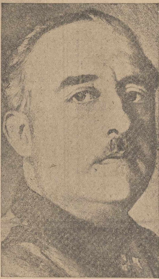
S. E. EL JEFE DEL ESTADO