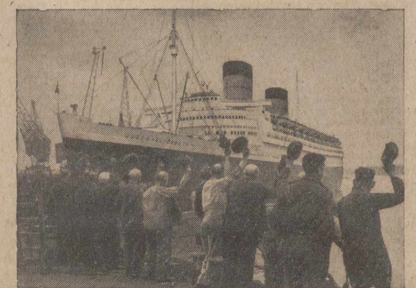
El coloso de los mares—así denominan los ingleses al «Queen Elizabeth»—es despedido por un grupo de obreros británicos que trabajó en su readaptación como trasatlántico, después de haber sido utilizado como transporte de tropas durante la guerra.