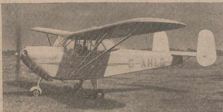
Fotografía tomada en el aeródromo de Londres, durante las pruebas realizadas con el taxi-aéreo «Christea Aceo», de cuatro plazas. Su precio no será superior a mil libras esterlinas.