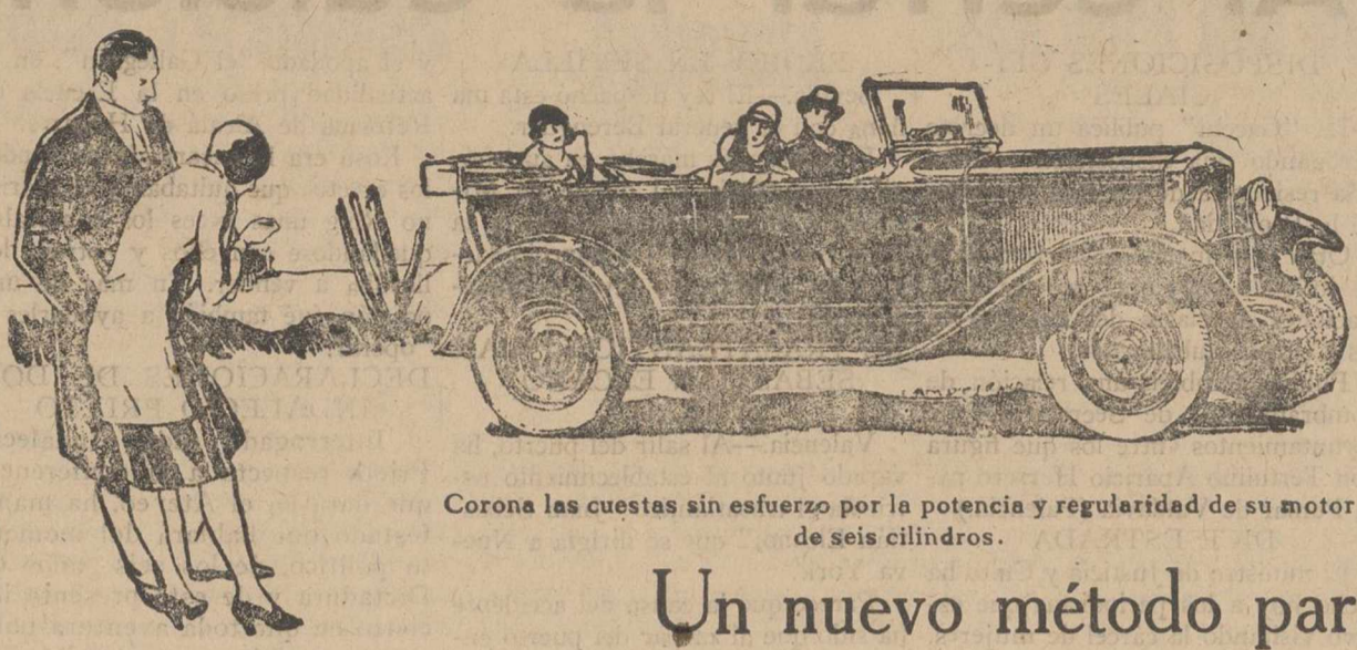
Corona las cuestas sin esfuerzo por la potencia y regularidad de su motor de seis cilindros.

NITRATO DE CHILE 15 a 16 por 100 de Nitrógeno Nítrico Producto natural que no acidifica las tierras ni quema las manos. SUS RESULTADOS INMEJORABLES: 1.º Se venden sin necesidad de pesar ni medir. 2.º Tiene un siglo de garantía de éxito en todos los suelos y cultivos de España. ADEMAS CONTIENE YODO INFORMES GRATIS Comité del Nitrato de Chile BARQUILLO, 21.—MADRID.—APARTADO, 6