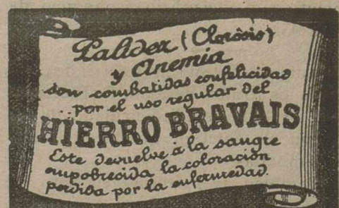
Depósito en todas las principales Farmacias