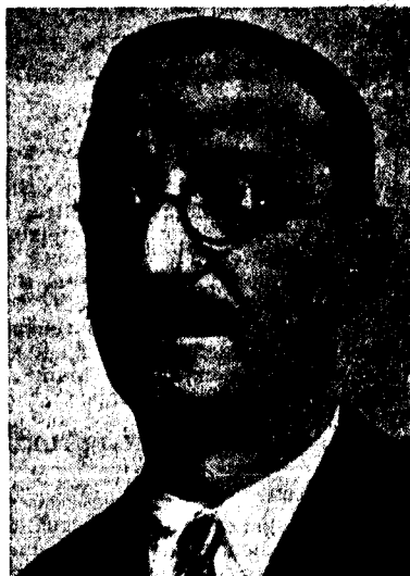
MANUEL SERRA MORET

Ha militat des de la seva joventut al Partit Socialista, el qual ha servit incansablement. El 12 d'abril del 1931 fou