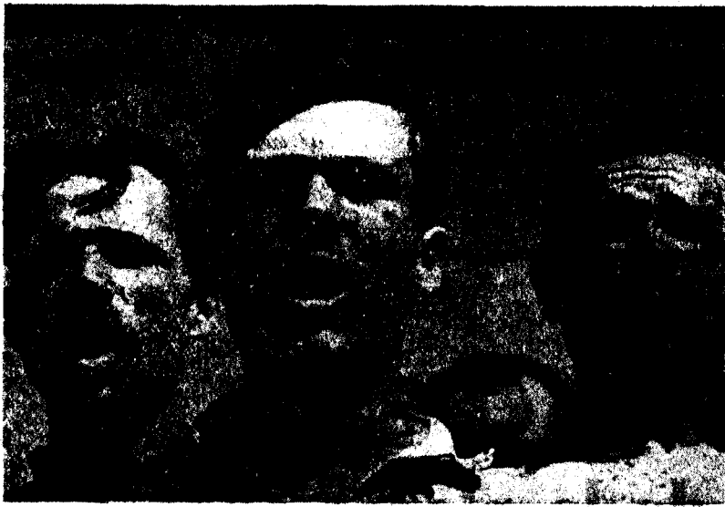
Cantem la Internacional, el cant de la revolució!