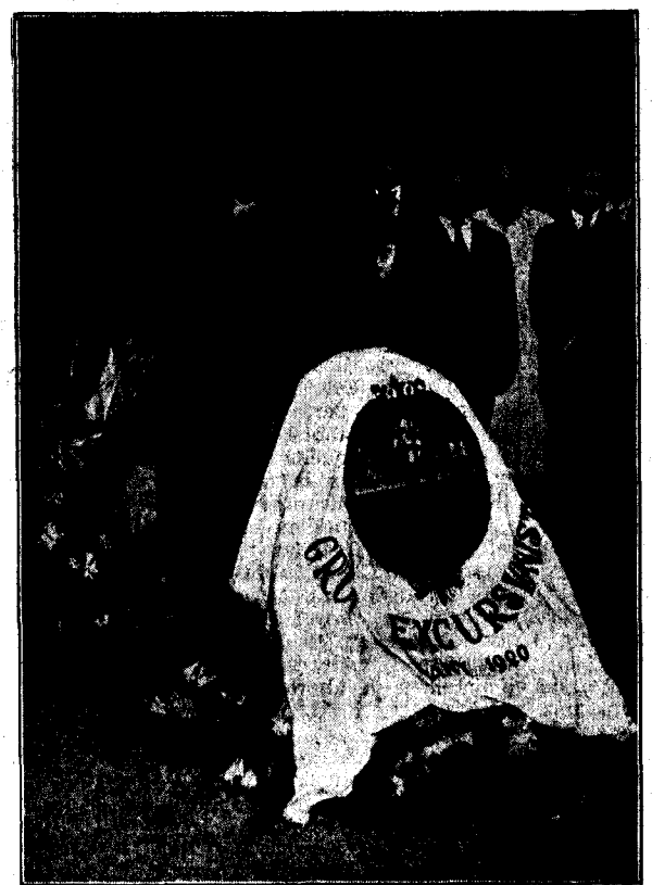
El ferret de Campalans exposat a l'Escola del Treball