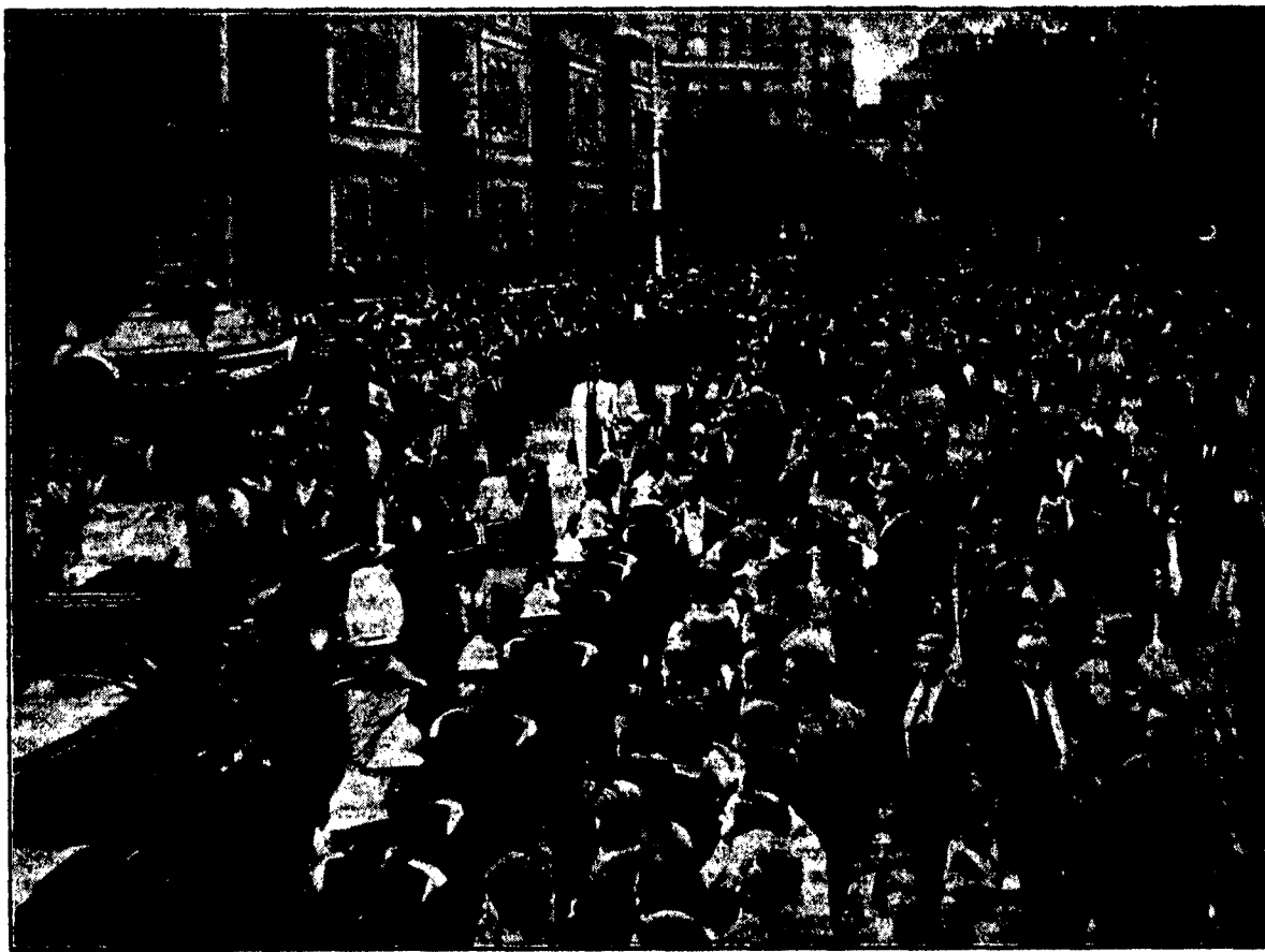
Una vista des del carrer Casanova, quan tot just una part de la Comitiva havia sortit de l'Escola del Treball