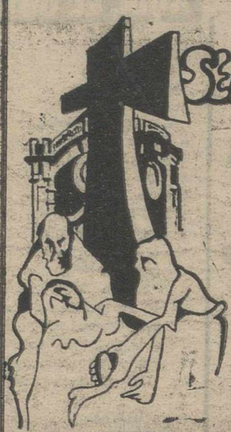
La imagen de Nuestra Señora de las Angustias, que se venera en una de