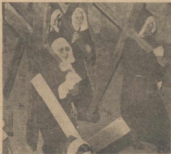
(A Cristo Crucificado)

Desde el Belén de tu gozosa infancia, hasta el Jerusalén donde culmina tu divina Pasión, ¿quién no adivina el glorioso milagro de tu estancia?