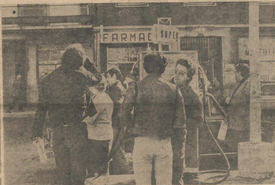
MADRID. — Foto del lugar donde fue asesinado don Jesús Haddad, director general de Prisiones, cuando iba en su coche. Ocurrió frente al número 20 de la calle de Cartagena.