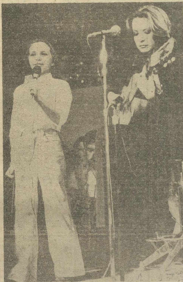
Fiesta apoteósica en la popular discoteca "Xandro's", que ha cumplido un año y unos cuantos días, de vida en la ciudad. Gran ambiente. Y