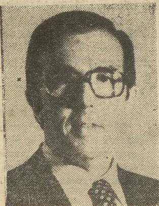
MADRID, 24. (Cifra). --- El ministro español de Asuntos Exteriores, Marcelino Oreja, salió a mediodía de hoy con destino a Nueva York para asistir a la Asamblea de la O.N.U.

SAHARA Y GIBRALTAR, TEMAS CENTRALES DE SU INTERVENCION ANTE LA ASAMBLEA