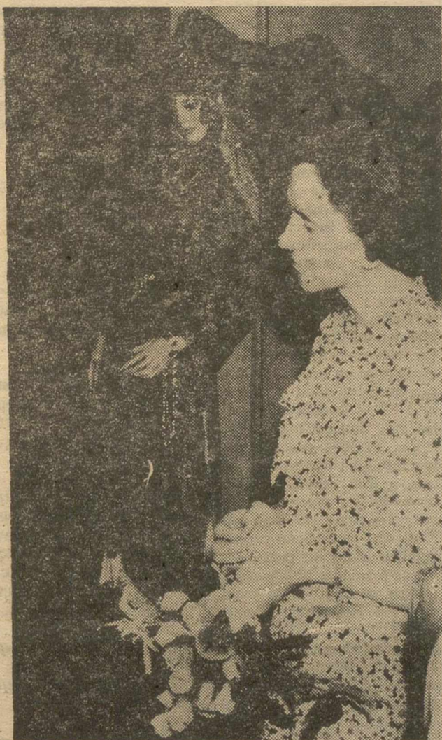
Un momento de ensueño: La Reina Fabiola de Bélgica, admira las tradiciones turcas, en uno de los puntos más animados de la exposición.

Las tradiciones no conocen las fronteras. Como las de los países escandinavos, las de Yugoslavia, Bulgaria, Checoslovaquia y Hungría son muy semejantes entre sí. Mientras que en Yugoslavia es frecuente que la joven haya de ser raptada, con su acuerdo o sin él, con el fin de evitarse los enormes gastos del matrimonio, en la exposición puede verse un espléndido baúl de casada procedente con seguridad de una unión en la que no hubo raptos; de una novia checoslovaca nos llega una pintoresca colección de tocados; de un novio búlgaro, un elborado adornado con flores y plumas; del mismo país, un pesado vestido de novia que había de utilizarse hasta mucho tiempo después del matrimonio y cualquiera que fuese el tiempo. En Hungría la figura central era el amigo del novio, y en la exposición