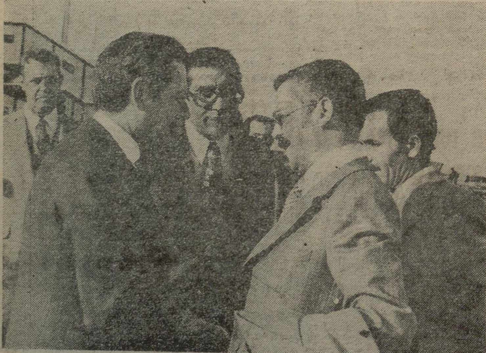
MADRID.—El coronel Mohamed Ben Amed Abdelgnani, ministro de la Gobernación y consejero de la Revolución de Argel, a su llegada al aeropuerto de Barajas, como enviado especial de Argelia a las conversaciones sobre el Sahara. Fue recibido por el subsecretario de Asuntos Exteriores, embajador de su país y el primer introductor de Embajadores.