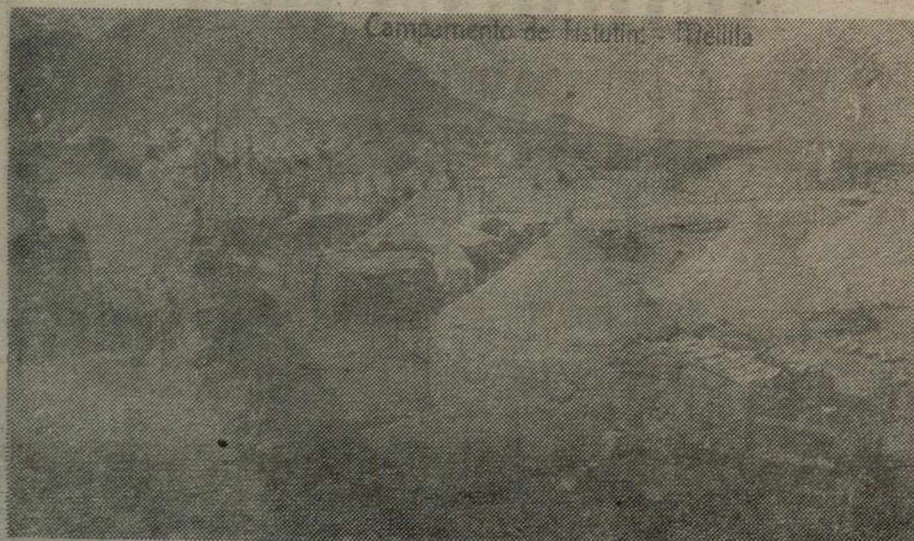
Campamento de Tistutin, en Melilla, durante la Campaña de Africa.