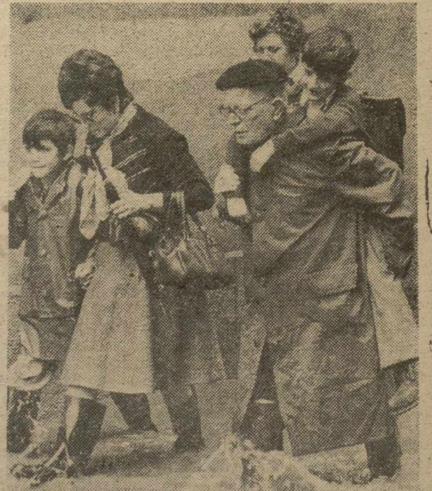
VALENCIA.—Debido a las intensas lluvias que se han registrado en las últimas horas en la región valenciana, se han producido inundaciones en barrios de la capital, sobre todo El Cabañol, La Malvarrosa y Nazaret.