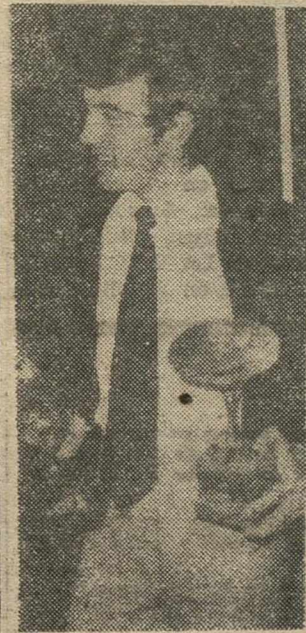
puesto en Puente Tocinos. Otro de ellos hizo el cuarto el domingo.

—¿Algún otro corredor de Albacete intervino también en esas pruebas? —Varios. El mejor clasificado de ellos fue Rumbó, que ocupó el quinto