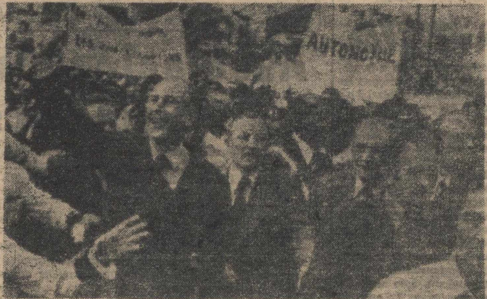
POINTE A PITRE.—El presidente francés, Valéry Giscard d'Estaing, saluda con la mano, a la gente que acudió a darle la bienvenida y a la que protestó por su llegada, en la Plaza Victoria, de Pointe a Pitre.