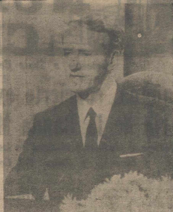
SALISBURY (Rodesia).—El primer ministro, Ian Smith, durante su histórico discurso por radio y televisión, cuando informó a la nación de que había recibido seguridades de un inmediato alto el fuego de los terroristas que habían estado en lucha de guerrillas, desde hace dos años, en Rodesia. El anuncio, también, la libertad de los líderes africanos detenidos y seguir las normales actividades políticas.