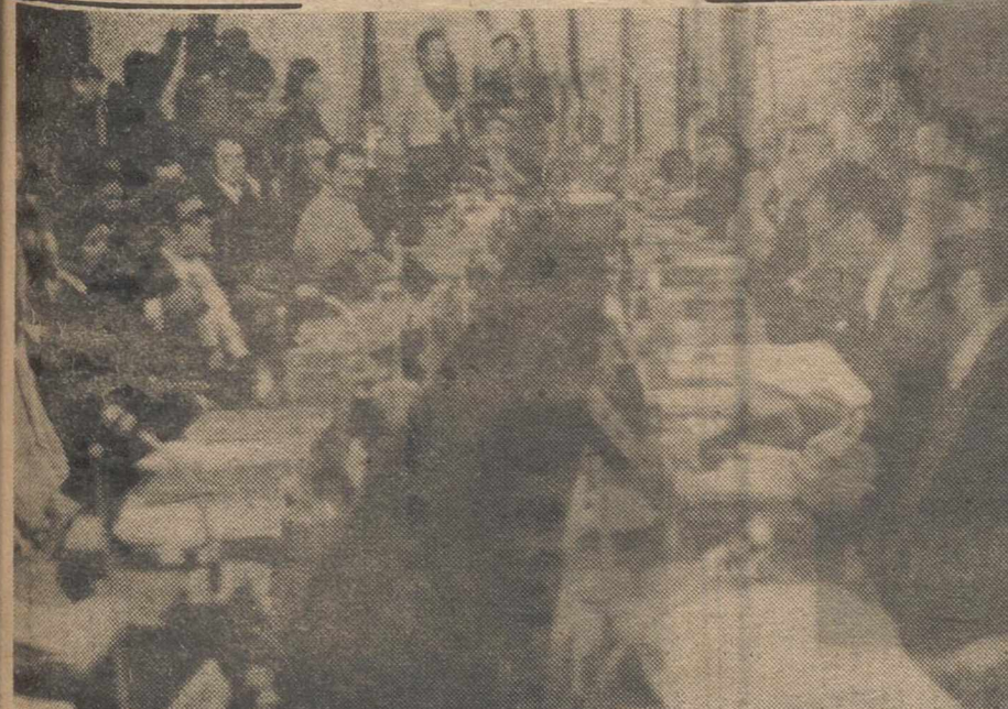
VIENA.—Vista general de la conferencia sobre los precios del petróleo de la Organización de Países Exportadores de Petróleo (OPEC), que se celebra en Viena.