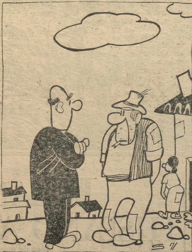
—Lo peor de este pueblo es que como todos son pobres, no se puede hablar mal de los ricos...