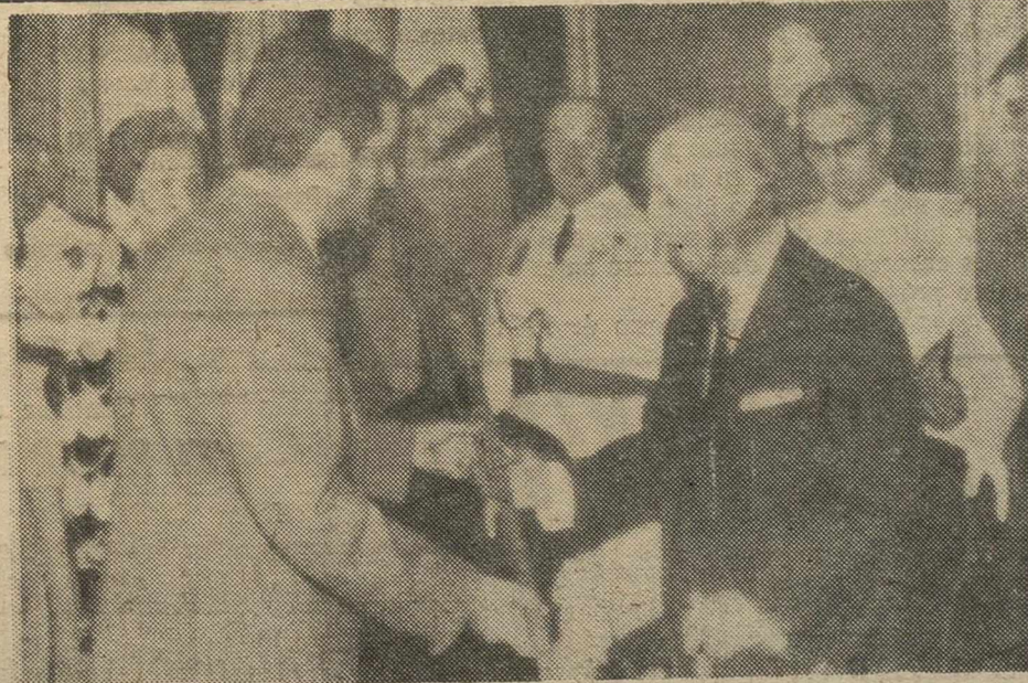
PUENTEVEDUME (La Coruña).—El Jefe del Estado recibe de manos del alcalde de Puentevedume, el ceiro de regidor perpetuo de la villa.