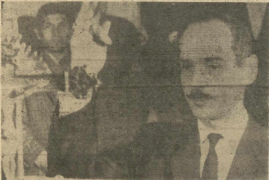
LA PAZ (Bolivia).—El coronel Hugo Banzer, nuevo presidente de Bolivia, aparece durante su juramento en la Casa del Gobierno. Fue la iniciativa de Banzer y otros disidentes, la que acabó con el régimen de Juan José Torres.

El presidente derrocado, Juan Torres, continua refugiado en la embajada de Perú