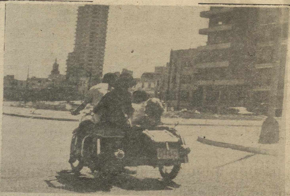
LA HABANA (Cuba).—Dos hombres y dos mujeres utilizan una moto con sidecar, como medio de transporte. No hay taxis en la «isla de Castro». (Telefoto AP-EUROPA PRESS).