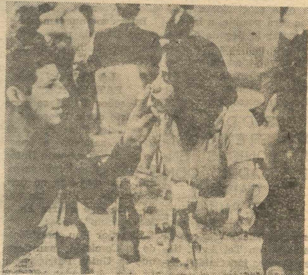
Esta fotografía de unos jóvenes en tertulia, está obtenida en un club de Moscú. La juventud soviética en nada difiere ya de la occidental.

Y es que desde hace mucho tiempo, las prisiones para jóvenes no son suficientes para acoger a los condenados. Para no reconocer abiertamente que su número debería ser considerablemente aumentado, otros centros para adultos son, poco a poco, dedicados exclusivamente a los delincuentes juveniles, sin que su denominación cambie. Por su parte, el Ejército Rojo tiene sus propias casas de “recuperación”, y ya se sabe lo