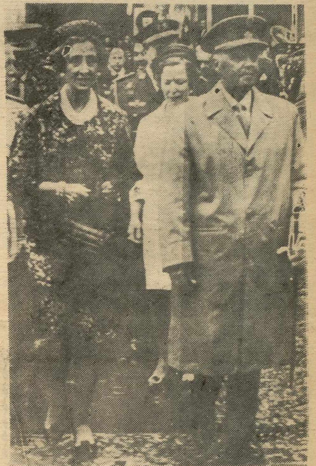
CASTELLON DE LA PLANA.—A su llegada a Castellón, acompañado por su esposa y entre las aclamaciones de la multitud, Su Excelencia el Jefe del Estado, se dirige hacia la Catedral, donde se celebró un Te Deum.

El Caudillo inauguró el nuevo edificio de la Jefatura Provincial del Movimiento y el complejo petroquímico más moderno de España y más importante de Europa