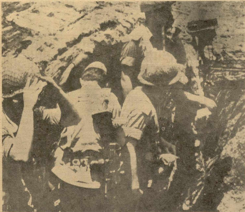
En el desierto Negev, cerca de Gaza Stripe, un grupo observador de avance del Ejército israelí, en una trinchera, preparándose para la eventual acción, que se desarrollaría doce horas más tarde, en esta zona.

Profundo avance del Ejército de Israel en la provincia de Sinaí y conquista de la ciudad egipcia de Gaza