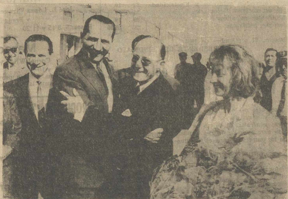
El presidente del Consejo Municipal de París, M. Legaret y el alcalde de Madrid, conde de Mayalde, se abrazan a la llegada del primero, acompañado de su esposa (derecha) y de los demás miembros de la Comisión Municipal parisiense, que han sido invitados por el ayuntamiento madrileño, a su llegada al aeropuerto de Barajas.—(Foto Fiel).