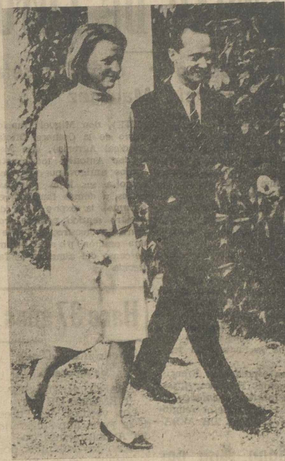
Los príncipes Carlos Hugo de Borbón y Parma e Irene de Holanda, han pasado un fin de semana en el palacio de Soestdijk, residencia de los padres de la princesa Irene, la reina Juliana y el príncipe Bernardo. En la foto vemos al príncipe Carlos Hugo y a la princesa Irene, regresando a palacio después de asistir a una misa.

Couve de Murville terminó diciendo que su país está más interesado en terminar el proyectado túnel anglofrancés bajo el Canal de la Mancha que en participar en la construcción de un canal interoceánico a través de Colombia.—Efe.