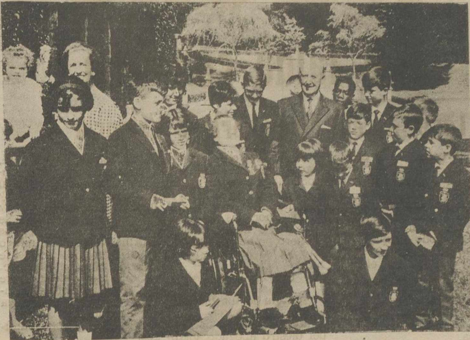
Los niños de la "Operación Plus Ultra", que actualmente recorren España, posan con el Jefe del Estado español, Generalísimo FRANCO, y sus nietos en el Pazo de Meirás, la residencia del Caudillo en La Coruña. Los niños—españoles y extranjeros—fueron seleccionados por una emisora y una línea aérea españolas por sus gestos heroicos.—(FOTOFIEL).