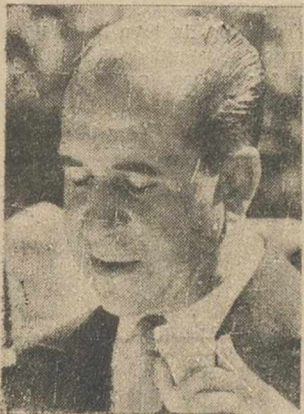
DISCURSO DEL PRESIDENTE DE LA DIPUTACION PROVINCIAL

«Queremos seguir mereciendo que la ciudad y la provincia de Albacete estén siempre orgullosas de las Fuerzas Aéreas» (General Pombo)