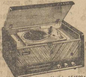
Modelo AE4520A Radiogramófono ASKAR de A.M.-F.M. (Vea otros modelos de la Serie 1962)