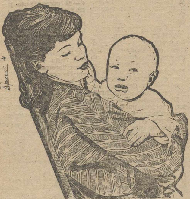
CON POLVOS HIGIENICOS