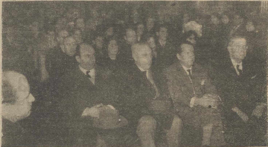
A la conferencia de don Julián Marias asistió numeroso público y varias autoridades, entre ellas el presidente de la Audiencia Territorial y el alcalde de la ciudad.

Conferencia de Julián Marias, inaugurando el IV curso de la Cátedra Pío XII de Albacete