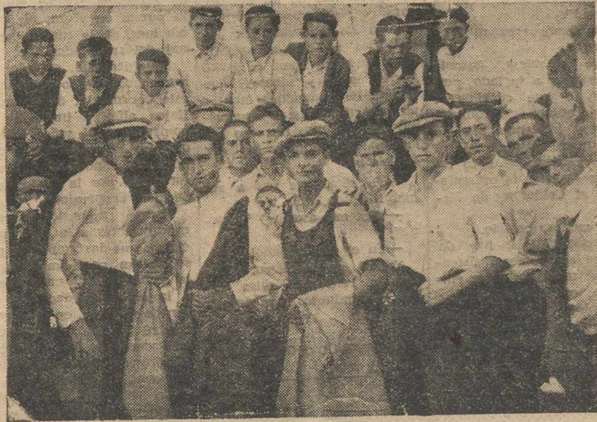
Chicuelo II en el descanso de una capea, con Pedrés y otros torerillos.

(Exclusiva LA VOZ DE ALBACETE—"Levante", de Valencia, "Sur", de Málaga.—Prohibida la reproducción total o parcial.