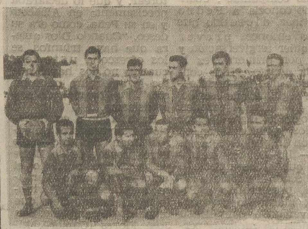
Este es el equipo de Almoradí—semi colista del X Grupo de la III División—que ayer, en su campo, acabó con las pocas esperanzas de nuestro Albacete Balompié, infligiéndole una dura derrota, decepcionante para nuestra afición.

red. Tal como hizo el Almoradí. Ni el Almoradí podía llegar a más, ni el Albacete a menos. Escasa afluencia —muy correcta, además— en las gradas, y una psicosis de derrota. Y un buen árbitro. Todo dispuesto para conseguir ese importante par de positivos echado a perder lastimosamente.