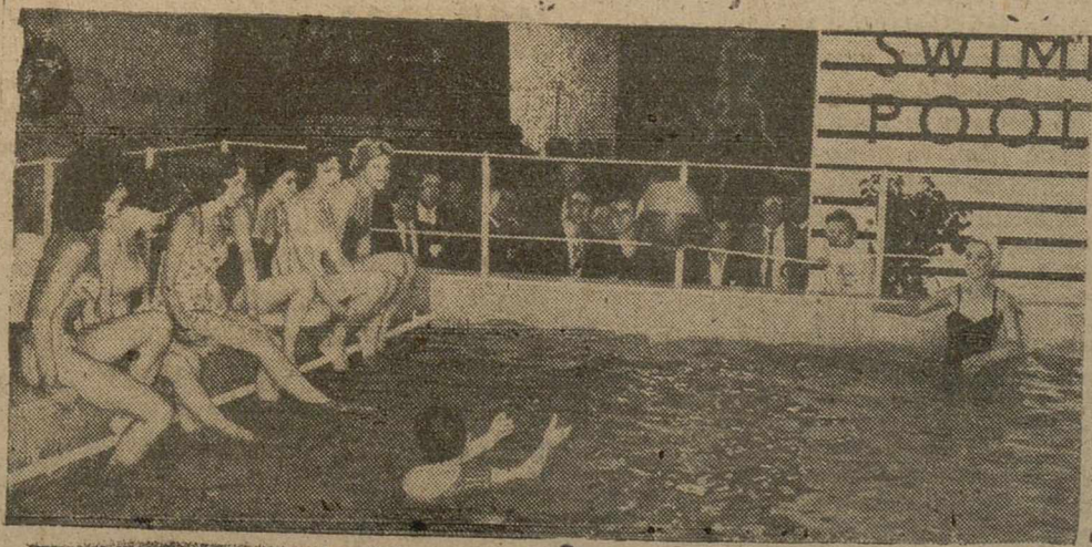
Entre los productos británicos exhibidos recientemente en la Exposición Internacional de Plásticos, celebrada en Olympia (Londres), figuraba una piscina de natación, que puede montar cualquiera en la casa o en el jardín, especialmente adecuada para enseñar a los niños a nadar. En esta fotografía tomada en la Exposición, un grupo de señoritas juegan en la piscina, que está fabricada de fibra de cristal reforzada.